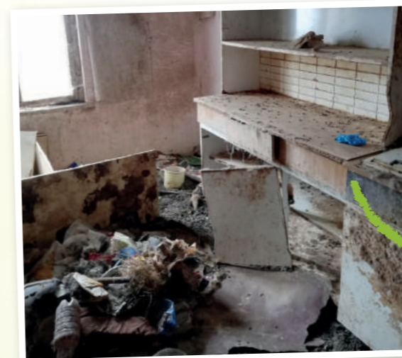
So hausten die Kaninchen vorher.

HIN-, NICHT WEGSEHEN! Hilf im Kampf gegen grausames Tierleid!