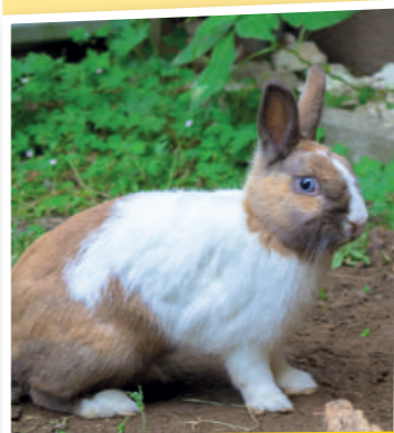
Moritz - KLT23100

Auf Anhieb in eines der Tiere verliebt? Melden Sie sich bei uns und erfahren Sie mehr über die Vierbeiner: 0463/43541-0 oder office@tiko.or.at