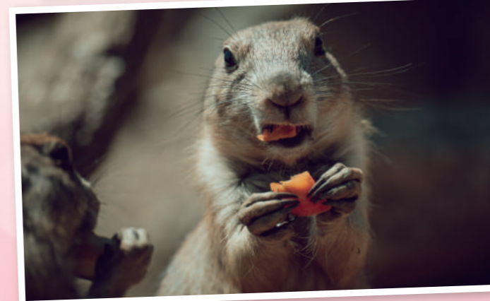
Bilder Katzen: © Nina Zeser Bilder Präriehunde: © Silvio Scheichl