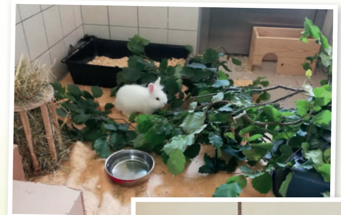
So leben die Kaninchen jetzt im TiKo.