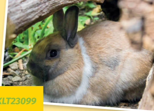
Maxi - KLT23099

Judendorfer Straße 46 9020 Klagenfurt a. W. Tel.: +43 664 52 808 44 www.tierarzt-annabichl.at