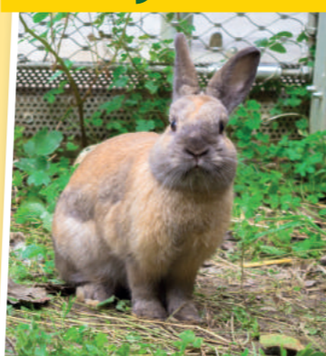
Monty - KLT23101