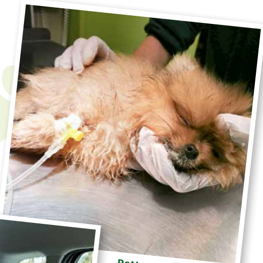
Rettende Erstversorgung im TiKo